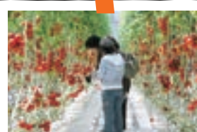
トマトのテーマパーク ワンダーファーム