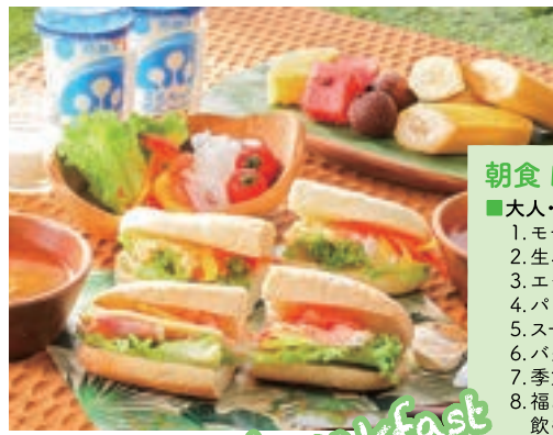
■大人・小学生朝食