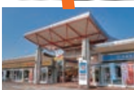
新鮮な魚介類市場 いわき・ら・ら・ミュウ